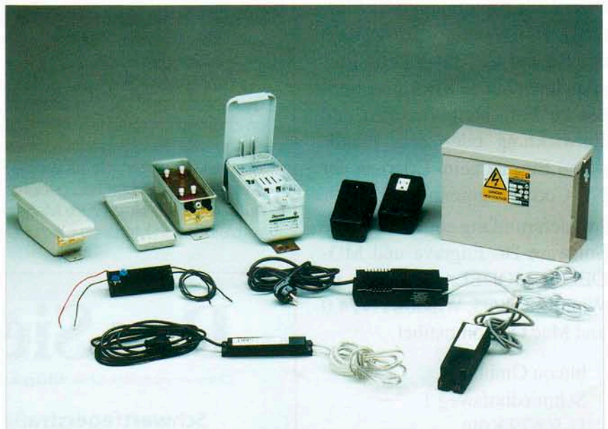
Transformatoren höchster Qualität: Neben den hauseigenen elektronischen Vorschaltgeräten vertriebt American Neons Transformatoren der Firmen »Tunewell« und »Diemme« in Deutschland exklusiv