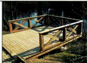
Holzterrasse von Hombach

Ferdi Hombach Holzverarbeitung, Wisserhof 3, 57537 Wissen / Sieg, Telefon 02742 6026, www.ferdi-hombach.de