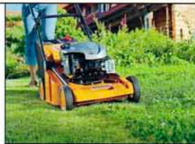
Mäher für Profis von AS-Motor

AS-Motor Germany GmbH & Co. KG, Lindenstraße 1, 74420 Oberrot, Telefon 07977 71-0, www.as-motor.de