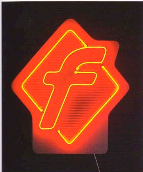
Appetit auf ein Würstchen? Der Fleischer hilft gern.

Die 1987 in Münster gegründete Firma ANS American Neons widmete sich anfangs dem Vertrieb amerikanischer Neondesigns. Später stellte sie individuelle Objekte her. Heute zählen unter anderem Leuchtdisplays und -stäbe, Leuchtstoffröhren, Licht-Filterröhren, Leuchtkästen und Lichtgardinen zum Sortiment. Seit 2002 bildet der Betrieb im kaufmännischen und mediengestalterischen Bereich aus. Er macht gegenwärtig circa drei Millionen Euro Umsatz und verfügt mittlerweile über eine Niederlassung in den USA sowie eine Produktionsstätte in Lettland. Der deutsche Standort verfügt über eine eigene Glasbläserei. ANS hält ungefähr 45 TÜV-Zertifikate und mehrere Patente sowie Schutzmarken, zum Beispiel für das auf einem Leuchtstab basierende Schildsystem Way-Light. Das Unternehmen überholt auch beschädigte und verschmutzte Neonobjekte.